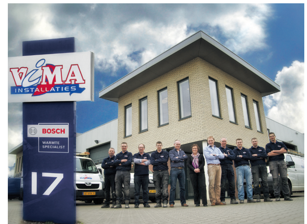
Het team van VIMA installaties staat voor u klaar

Nog een nieuwtje. HR techniek heeft zijn bovengrens bereikt wat rendement betreft. Diens opvolger, de HRe-ketel, komt eraan. Het is een cv ketel die warmte en warm water levert en daarnaast ook elektriciteit opwekt via de ingebouwde Sterling motor. "Eén leverancier heeft hem nu op de markt gebracht, de rest is bezig. De HRe -ketel moet echt nog worden